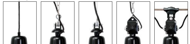
Kabel-Aufhängung K/... Alu-Gussaufhängung mit vernickelter Kette AGK/... Alu-Gussaufhängung mit Stahlseil AGS/... Alu-Kabel-Box mit vernickelter Kette ABK/... Alu-Kabel-Box mit Seilaufhänger ABS