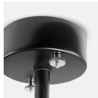
Schraubverbindungen Messing vernickelt