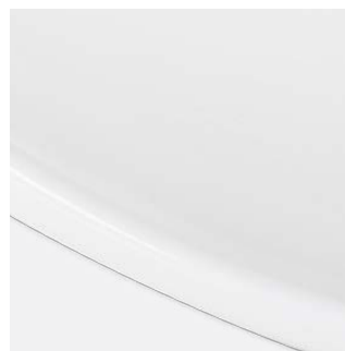
Blendrand der Deckenaussparung