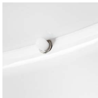
Federknopf zum Befestigen der Plexiglasscheibe