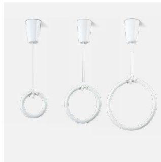
Ringröhre T9 FC in unterschiedlichen Durchmessern

Pendelrohr in Wunschlänge möglich Sonderausführungen und RAL-Lackierungen möglich