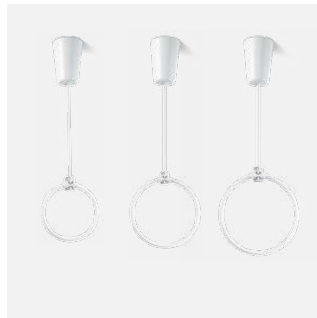
Ringröhre T5 FC in unterschiedlichen Durchmessern

Pendelrohr in Wunschlänge möglich Sonderausführungen und RAL-Lackierungen möglich