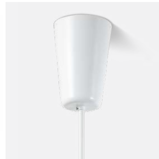
Baldachin in Zylinderform (Größe abhängig von Wattage und Dimmung) mit Pendelrohr Ø 10 mm