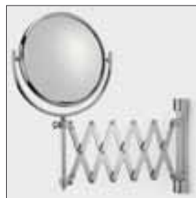
Optisches Glas, aufwendig verarbeitet: Spiegel Scherenmechanik.