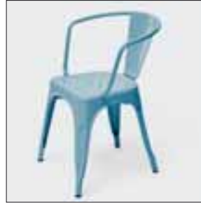
Komfortabel und stabil: Tolix Stahlmöbel.