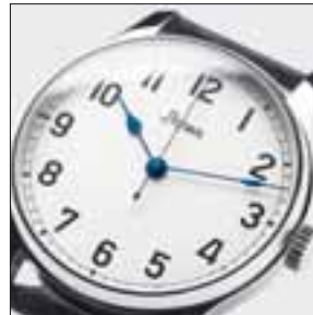
Zifferblatt aus massivem Silber: Stowa Marine.