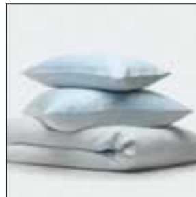
Schlafkomfort für warme Nächte: sommerliche Bett- waren.