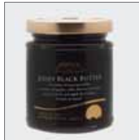
Fruchtig-würzige Spezialität: Jersey Black Butter.