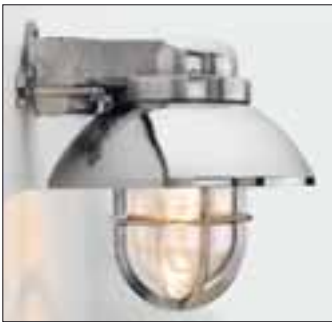
Wandarm mit (hängendem) Leuchtaufsatz und Schirm Messing verchromt

teneinsatz und Leuchtaufsatz (wahlweise mit oder ohne Schirm) bzw. aus Wandarm und Leuchtaufsatz (ebenfalls wahlweise mit oder ohne Schirm) besteht.