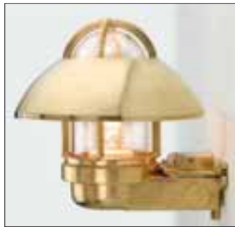
Wandarm mit (stehendem) Leuchtaufsatz mit Schirm Messing blank